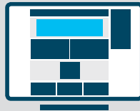
Wideboard Desktop 994 x 250 px