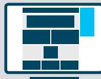
Halfpage nur Desktop 300 x 600 px