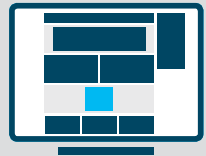
Rectangle Desktop 300 x 250 px